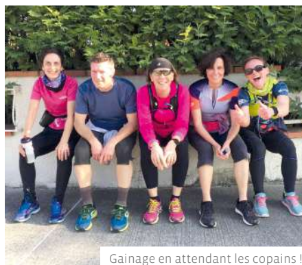
Gainage en attendant les copains !

N'hésitez pas à nous contacter pour plus de renseignements (Patricia Rouquette), de préférence par mail :