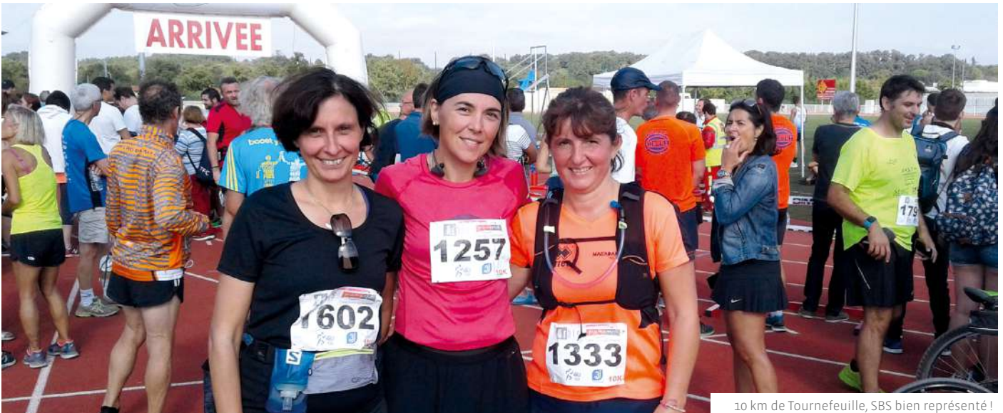
10 km de Tournefeuille, SBS bien représenté !

Sidebyside est une association sportive regroupant une vingtaine de membres autour de la course à pied.