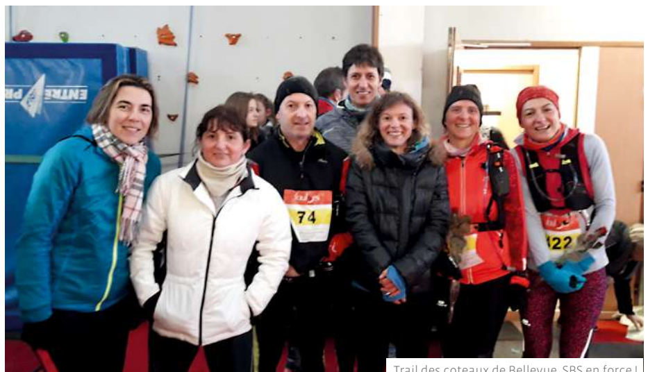
Trail des coteaux de Bellevue, SBS en force !

Certains des membres participent à des courses sur route ou trail.