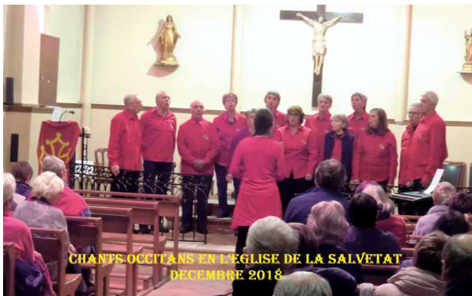
CHANTS OCCITANS EN L'ÉGLISE DE LA SALVETAT DECEMBRE 2018

Notre cité doit s'enorgueillir du château Raymond IV qui trône en son centre, il nous rappelle nos origines, il est chaque jour plus fier et beau par la restauration en cours.