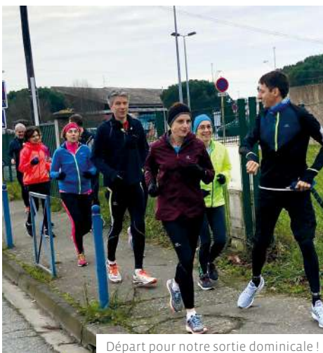
Départ pour notre sortie dominicale !