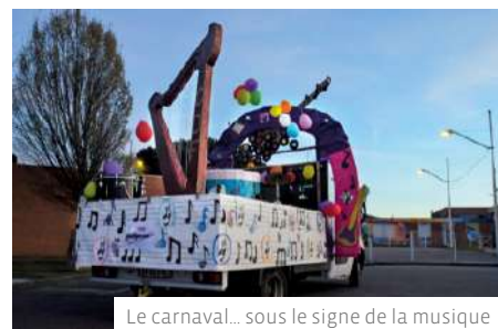
Le carnaval... sous le signe de la musique