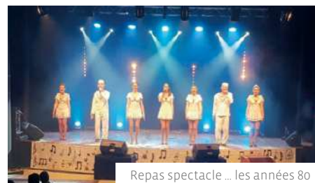
Repas spectacle ... les années 80

Nous serons également présents le 7 septembre lors du Forum des Associations afin de répondre à vos interrogations.