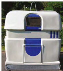
Récup' TRI EN MÉLANGE