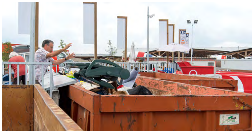
LA NOUVELLE DÉCHÈTERIE DE PLAISANCE-DU-TOUCH

➔ Localisez la déchèterie la plus proche de chez vous !